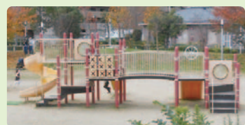
4 吉野町公園 吉野4-12