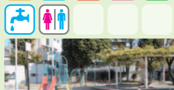
16 中江町公園 吉野1-15