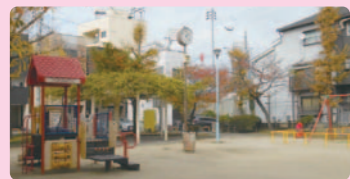
17 海老江公園 海老江7-15