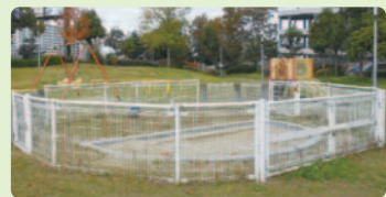
9 新家公園 吉野5-9