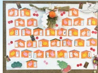
利用者様みんなで作りました