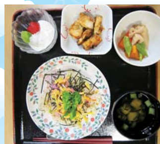
栄養たっぷり手作りの昼食

福島区在住で、介護保険において要支援・要介護 認定を受けた方を対象に「送迎」「入浴」「手作 りのお食事」を提供しています。 スタッフや利用者の皆さんと一緒に簡単な体操 やゲーム、頭の体操等を行ったり、 歌体操・コーラス・フルート・日舞・ バイオリン等のボランティアさん なども来ています。 また、傾聴ボランティアさんや 介護予防ポイントボランティアさん も増え、利用者の皆さんと 楽しいひとときを過ごされています