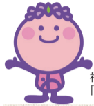
福島区協マスコットキャラクター「なごみちゃん」

編集・発行 社会福祉法人 大阪市福島区社会福祉協議会 〒553-0001 大阪市福島区海老江6-2-22 あいあいセンター内