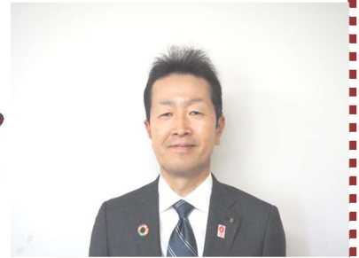
福島区長 工藤 誠氏

※区長にお聞きになりたい事などは、センター窓口にある質問用紙にお書きのうえ、アンケート箱へお入れください。よろしくお願ひいたします。 締切日 3/7 (金)