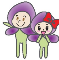
フッピー&グッピー