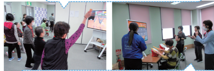
ゲーム自体初体験でしたが抵抗なく参加できました!