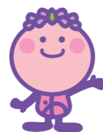
福島区社協 公式キャラクター なごみちゃん