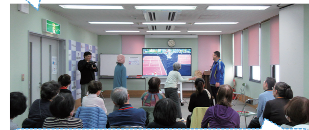
身体と脳を同時に鍛えられるので良かったです。