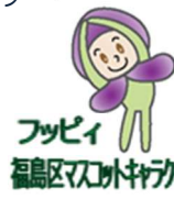
フッピー 福島区大広間